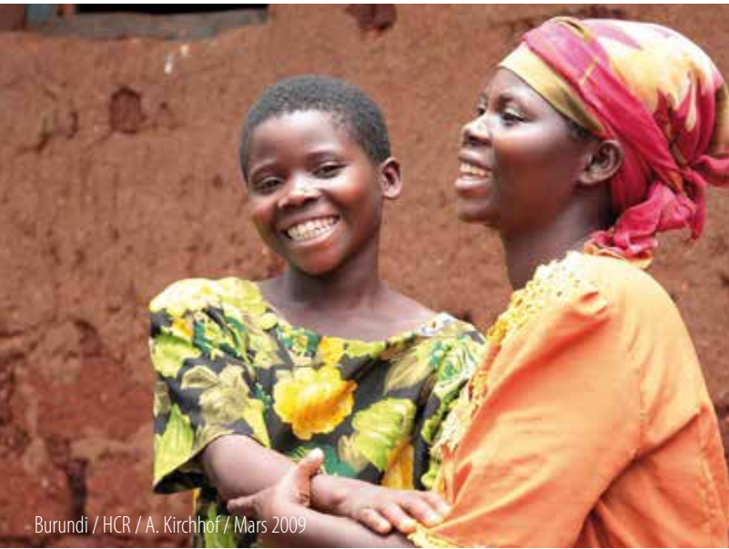
Burundi / HCR / A. Kirchof / Mars 2009