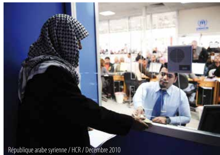
République arabe syrienne / HCR / Décembre 2010

La politique sur les alternatives aux camps recentre l'attention sur les réfugiés qui vivent dans des camps et étend les principaux objectifs de la politique relative aux réfugiés urbains à toutes les situations opérationnelles. La politique relative aux réfugiés urbains a indiqué qu'il est généralement tenu pour acquis que les réfugiés basés dans des camps reçoivent une assistance indéfinie s'ils ne peuvent pas s'engager dans l'agriculture ou dans d'autres activités économiques. La politique sur les alternatives aux camps remet en cause cette hypothèse et appelle le HCR à se consacrer à l'élimination des obstacles dans l'exercice des droits et l'atteinte d'une autonomie, en vue de faire de ce que le HCR désigne historiquement par des programmes « de secours » des exceptions de plus en plus rares.