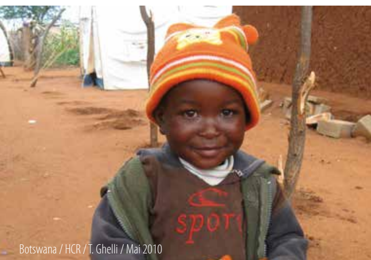
Botswana / HCR / T. Ghelli / Mai 2010

Adaptation de la fourniture de services dans les domaines de l'éducation, de la santé publique, de la nutrition, de l'eau et de l'assainissement pour soutenir les alternatives aux camps et répondre aux besoins des réfugiés qui vivent dans les communautés d'accueil par le biais d'une rationalisation au sein des systèmes et des structures aux niveaux national, local et communautaire et par le développement complémentaire d'un nouvel ensemble de modèles et d'approches, comme l'utilisation d'équipes mobiles, l'amélioration des mécanismes de référencement, l'enrôlement des réfugiés dans les régimes d'assurance maladie, l'expansion de l'accès à des programmes d'enseignement à distance et l'augmentation de l'utilisation d'interventions monétaires.