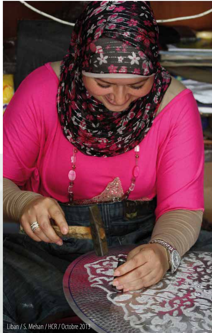
Liban / S. Mehan / HCR / Octobre 2013

La politique sur les alternatives aux camps établit une responsabilité des activités du HCR sur le terrain pour entreprendre des efforts stratégiques mieux ciblés pour rechercher des alternatives aux camps, dans le cadre de l'orientation stratégique globale des Bureaux régionaux et avec le soutien des divisions concernées du siège. La politique appelle également le HCR à adapter les systèmes, les procédures et les approches et à développer de nouvelles compétences, capacités et expertises et de nouveaux partenariats à travers les fonctions de protection, de gestion des programmes et d'interventions d'urgence.